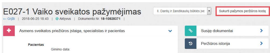
1 paveikslas. Sukurti pažymos peržiūros kodą