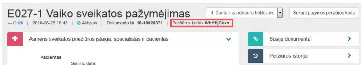
3 paveikslas. Sugeneruotas peržiūros kodas

Sistema sugeneruoja naują pažymos peržiūros e. sveikatos portale kodą, kuris parodomas atnaujintame medicinines pažymos peržiūros lange.